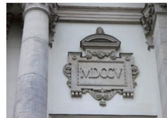
Eine römische Jahreszahl an einer Kirchenwand

Wenn du ganz aufmerksam bist, kannst du manchmal an alten Gebäuden ein lateinisches Sprichwort, eine kleine Inschrift oder eine Jahreszahl in römischen Zahlen entdecken. Kennst du so einen Ort in deiner Nähe? Diskutiert in eurer Klasse oder fragt euren Lehrer.